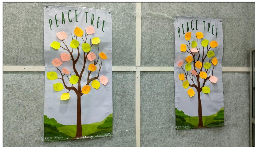
Gambar 2. Peace Tree

Selain mendengarkan penyampaian materi, peserta juga terlibat dalam berbagai aktivitas dalam setiap sesinya. Ketika pemberian materi mengenai membina hubungan sosial yang sehat, peserta diminta untuk menuliskan satu nama seseorang yang memiliki peran penting dalam hidup mereka pada sticky note berbentuk daun, serta kata-kata positif yang menggambarkan hubungan damai mereka dengan orang tersebut. Sticky notes tersebut kemudian ditempelkan di gambar batang pohon besar yang telah disediakan fasilitator, membentuk Peace Tree yang penuh dengan nilai-nilai positif. Aktivitas ini bertujuan untuk membangun kesadaran peserta akan pentingnya hubungan sosial yang sehat dan menumbuhkan rasa syukur terhadap dukungan orang-orang terdekat dalam hidup mereka.