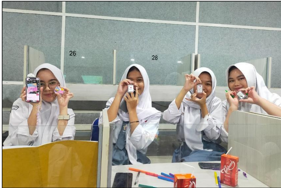
Gambar 3. Peace Keychain