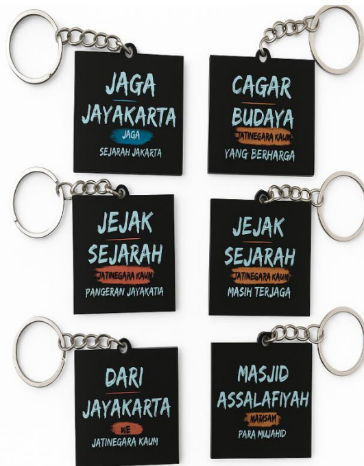
Gambar 7. Produk Kebahasaan pada Gantungan Kunci

Dari sisi sintaksis, teks-teks tersebut disusun dalam bentuk frasa nominal dan klausa sederhana yang padat, komunikatif, dan mudah diingat. Pilihan struktur ini sesuai dengan karakteristik media berukuran kecil seperti gantungan kunci, yang membutuhkan teks singkat namun tetap memiliki daya pesan yang kuat. Secara fungsional, gantungan kunci ini berperan sebagai souvenir budaya yang praktis sekaligus strategis. Pesan-pesan kebahasaan yang tertera tidak hanya memperkuat identitas Jatinegara Kaum sebagai kawasan cagar budaya, tetapi juga menumbuhkan kebanggaan kolektif masyarakat terhadap warisan sejarah dan religius yang dimilikinya. Kalimat seperti “Jaga Jayakarta, Jaga Sejarah Jakarta” memiliki nilai persuasif, mengajak masyarakat secara langsung untuk berpartisipasi dalam pelestarian sejarah. Sementara itu, teks “Masjid Assalafiyah, Warisan Para Mujahid” menegaskan dimensi spiritual yang melekat pada kawasan ini, sehingga menambah bobot makna dari promosi budaya.