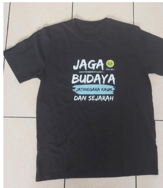
Gambar 3. Produk Kebahasaan pada Kaus

Pada rompi, ditampilkan teks kebahasaan berupa slogan “Jatinegara Kaum, Jejak Dakwah dan Sejarah” yang dirancang dalam bentuk frasa nominal sederhana, tetapi tetap sarat makna. Struktur sintaksis yang digunakan menekankan aspek deskriptif sehingga mampu menghadirkan identitas kuat tentang posisi Jatinegara Kaum sebagai kawasan bersejarah. Secara sintaktis, struktur frasa ini menegaskan identitas kawasan Jatinegara Kaum tidak hanya sebagai ruang geografis, tetapi juga sebagai pusat sejarah dan dakwah Islam yang memiliki nilai kultural tinggi. Rompi ini tidak hanya berfungsi sebagai perlengkapan kegiatan, tetapi juga sebagai media berjalan yang secara langsung menyampaikan pesan promosi ketika digunakan oleh masyarakat.