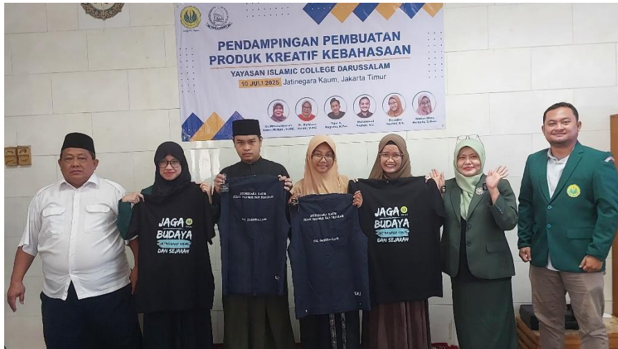
Gambar 1. Kegiatan Pengabdian kepada Masyarakat

produk kreatif kebahasaan dalam bentuk souvenir dan merchandise. Materi disampaikan secara interaktif dengan melibatkan peserta untuk mengidentifikasi dan menganalisis contoh-contoh kalimat promosi yang efektif.