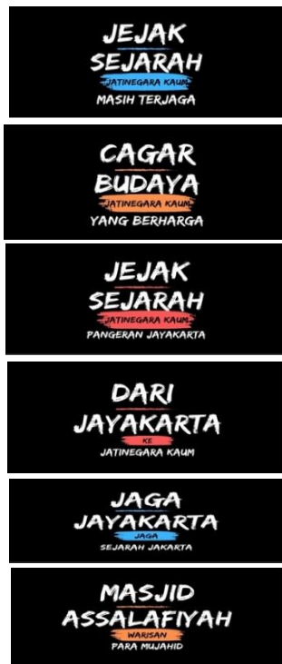
Gambar 6. Desain Gantungan Kunci pada Canva