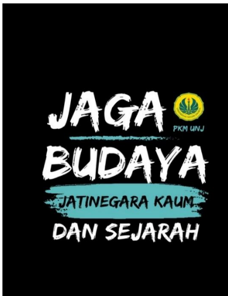
Gambar 2. Desain Kaus pada Canva