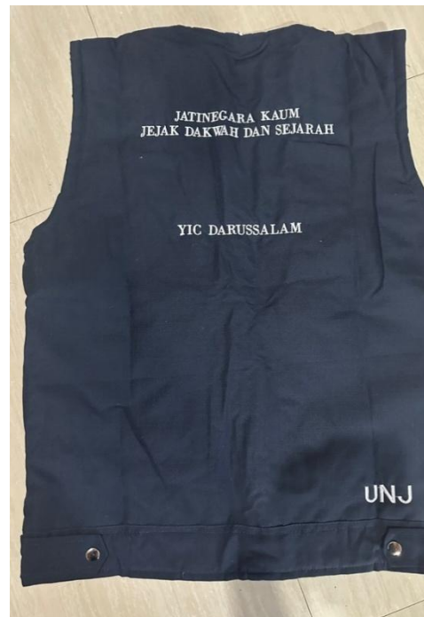
Gambar 5. Produk Kebahasaan pada Rompi

Selain kaus dan rompi, dihasilkan juga produk gantungan kunci. Beberapa contoh teks yang ditampilkan antara lain: “Jatinegara Kaum, Jejak Sejarah Masih Terjaga”, “Jatinegara Kaum, Cagar Budaya yang Berharga”, “Jatinegara Kaum, Jejak Sejarah Pangeran Jayakarta”, “Dari Jayakarta ke Jatinegara Kaum”, “Jaga Jayakarta, Jaga Sejarah Jakarta”, dan “Masjid Assalafiyah, Warisan Para Mujahid”.