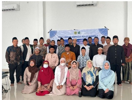
Gambar 1. Foto Bersama para peserta kegiatan Pengabdian Masyarakat

Foto dan 7 jam dokumentasi video kegiatan telah dikumpulkan. Analisis terhadap ekspresi peserta, keterlibatan dalam diskusi, serta perubahan postur komunikasi mereka selama kegiatan menunjukkan adanya peningkatan signifikan dalam aspek kepercayaan diri, kemampuan menyampaikan gagasan, dan keterbukaan terhadap metode baru