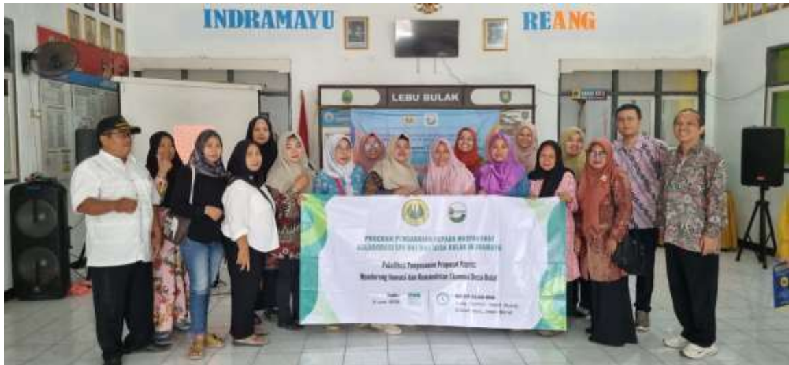
Gambar 2. Panitia dan Peserta

Sebelum dan sesudah pelatihan peserta diminta untuk mengisi pre tes dan pos tes yang tujuannya untuk mengukur sejauh mana keberhasilan kegiatan tersebut. Hasil prtes dan pos tes disajikan pada grafik 1 dan grafik 2. Dari hasil pre tes dan pos tes terlihat bahwa terdapat kemajuan pengetahuan dan keterampilan pada peserta pelatihan. Hal ini menunjukkan bahwa pelatihan berhasil dilaksanakan dan berdampak kepada para peserta pelatihan. Meskipun masih terdapat beberapa peserta yang belum memahami, hal ini menjadi evaluasi bagi SPI UNJ untuk perbaikan kedepannya.