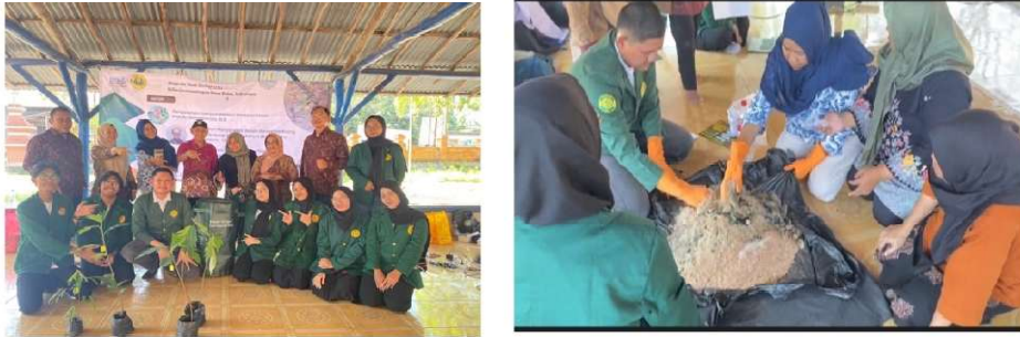
Gambar 1. Praktek pembuatan kompos organik oleh peserta

Materi PKM tersampaikan dengan baik, diskusi berjalan dengan lancar dan kondusif hal ini terlihat dari antusiasme dari para peserta untuk bertanya, dan mengemukakan pendapat. Tumbuhnya motivasi dan kesadaran peserta serta tercipta suasana menyenangkan selama kegiatan, hal ini dikarenakan menurut peserta materi yang disampaikan merupakan materi yang baru diketahui secara lebih gamblang, sehingga permasalahan tentang bahaya limbah organik dan pengelolaannya lebih difahami oleh peserta. Adanya permintaan untuk diadakan kegiatan serupa dengan materi yang berbeda sangat mereka harapkan.