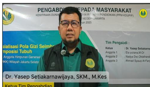
Gambar 3. Dokumentasi Video

Peningkatan pengetahuan dan pemahaman peserta terkait dengan pola gizi seimbang dan komposisi tubuh didukung oleh serangkaian tahapan kegiatan pengabdian kepada masyarakat. Tahapan tersebut mengacu pada tahapan pemberdayaan masyarakat yakni meliputi tahapan proses penyadaran, pengilmuan, penerapan, dan pengembangan (Sulistiyani, 2013) dalam (Sulistiyani & Wulandari, 2017). Tahap penyadaran yakni peserta diberikan pengalaman langsung untuk mengetahui kondisi tubuh dan status gizi melalui pengukuran komposisi tubuh menggunakan alat berupa Bioelectrical Impedance Analysis (BIA). Hasil pengukuran kemudian disampaikan kepada peserta sehingga menimbulkan kesadaran tentang pentingnya menjaga gizi seimbang serta memahami risiko kesehatan apabila terjadi gizi kurang maupun gizi lebih. Tahap pengilmuan, yakni melakukan sosialisasi menggunakan metode ceramah dan dipadukan dengan diskusi interaktif dan tanya jawab guna untuk mentransfer pemahaman dan pengetahuan terkait dengan gizi seimbang dan standar komposisi tubuh ke peserta.