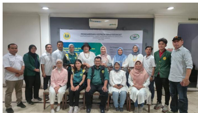
Gambar 2. Pengabdian Kepada Masyarakat pada Anggota HGMKK Jabodetabek