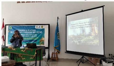
Gambar 1. Pemaparan Materi oleh Nara Sumber

Untuk memberikan penguatan tentang wawasan lingkungan dan program green dakwah , pemateri mengawali penyampaian materi tentang fenomena dan permasalahan akut kerusakan lingkungan akibat eksploitasi sumber daya alam seperti eksploitasi kegiatan pertambangan yang mengancam bencana alam (Mawardi Heru Prasetyo et al., 2025), Eksploitasi berlebihan terhadap sumber daya alam juga menyebabkan kerusakan ekosistem, perubahan iklim, dan ketidakseimbangan ekonomi (Melo et al., 2024).