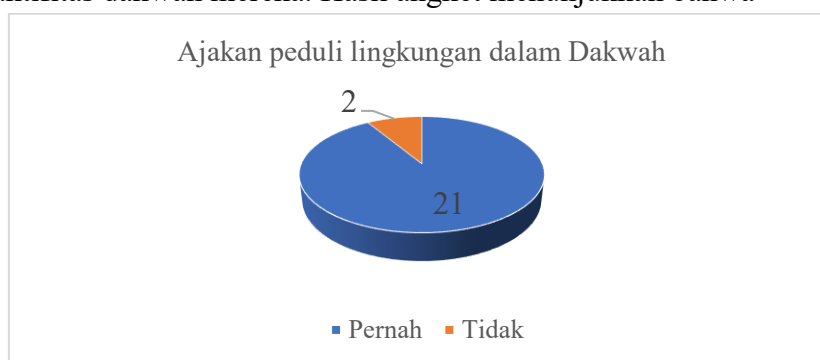
Diagram 3. Ajakan Da'i tentang Peduli Lingkungan dalam Dakwah

Selanjutnya aspek ketiga yang ditelusuri komitmen da'i terhadap kepedulian lingkungan sepanjang aktifitas dakwah mereka. Hasil angket menunjukkan bahwa