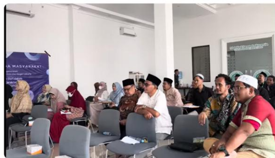
Gambar 2. Peserta Pelatihan Dai

Pemateri menekankan tentang pentingnya peran dai sebagai agen perubahan sosial dan moral umat, sekaligus perlunya sinergi dakwah dengan isu lingkungan. Wawasan tentang landasan teologi dan hukum Islam tentang konservasi lingkungan disampaikan dalam ilustrasi ringkas materi lingkungan dalam Kajian Islaman berikut: