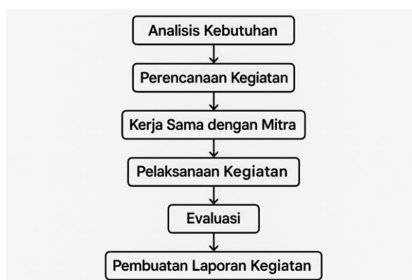
2. Gambar Alur Kegiatan Pendampingan

Adapun kegiatan ini dilakukan melalui beberapa tahapan sebagaimana digambarkan pada alur berikut;