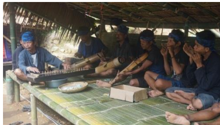
Gambar 3. Pakaian Khas BaduyLuar

Masyarakat Baduy Luar adalah salah satu yang mengalami perubahan sosial yang cukup cepat karena pada dasarnya di wilayah ini mempunyai aturan adat yang cukup longgar dibandingkan Baduy Dalam. Untuk cara berpakaian sendiri di masa awal, orang Baduy Luar memakai pakaian khas, yaitu dengan pakaian serba hitam dan ikat kepala berwarna biru. Namun, pada hasil pengamatan observasi penulis melihat bahwa saat ini sebagian besar orang-orang Baduy Luar sudah tidak memakai pakaian khas mereka, yaitu pakaian serba hitam dan ikat kepala hitam. Saat ini mereka sudah memakai pakaian seperti orang di luar Baduy pada umumnya dan orang Baduy Luar sudah terbiasa memakai alas kaki. Dalam hal tata cara berpakaian, orang Baduy Luar sudah mengalami perubahan sosial karena interaksi yang intensif dengan para pengunjung wisata dan hal ini bisa dilihat dari cara berpakaian orang Baduy Luar yang sudah memakai baju orang luar baduy pada umumnya.