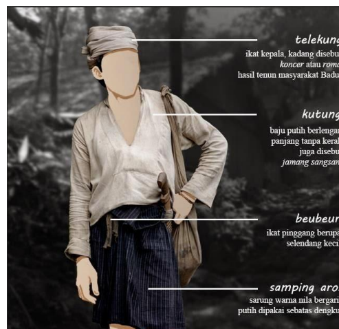
Gambar 5. Penjelasan komponen pakaian khas Baduy Dalam