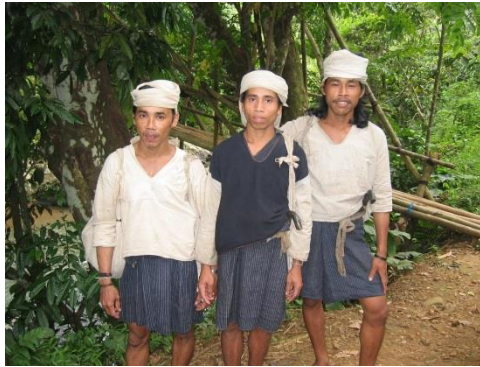
Gambar 4. Pakaian Khas Baduy Dalam

Kemudian setiap komponen pakaian khas dari Baduy Dalam terdapat manfaat dan arti tersendiri, seperti akan dijelaskan di bawah ini: