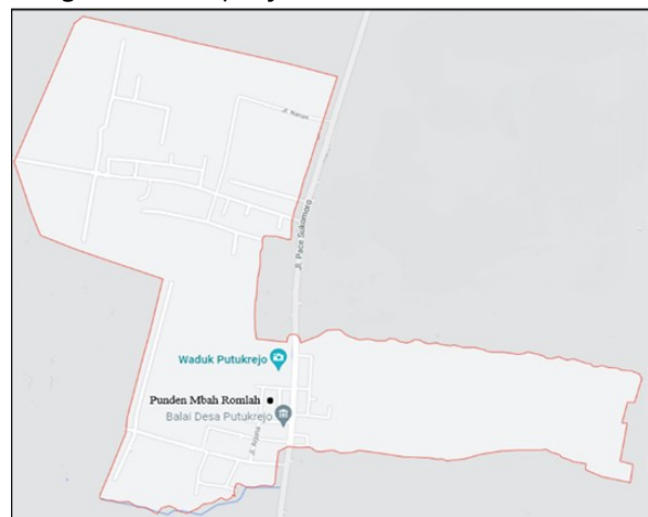
Gambar 2. Peta Administrasi Desa Putukrejo, Loceret, Nganjuk Jawa Timur

Desa Putukrejo yang merupakan salah satu desa yang terletak di kecamatan Loceret, kabupaten Nganjuk. Desa Putukrejo secara geografis terletak pada kordinat 7°36'0" Lintang Selatan dan 111°53'0" Bujur Timur, memiliki luas wilayah 1,56 Km 2 . Desa Putukrejo pada bagian utara berbatasan dengan Desa Nglaban, pada bagian barat berbatasan dengan Desa Kenep, pada bagian selatan berbatasan dengan Desa Kecubung dan pada bagian timur berbatasan dengan Desa Kepanjen.