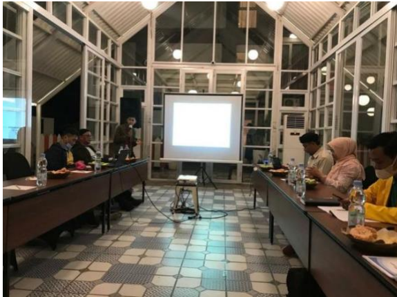
Gambar 4. Diskusi Kajian Lapangan Gunung Padang

Setelah proses pengambilan data di lapangan selesai kemudian pada malam harinya mahasiswa bersama dosen melakukan diskusi mengkaji/membahas mengenai objek yang telah dikunjungi. Mahasiswa dituntut untuk aktif bertanya serta berdiskusi terkait data di lapangan.