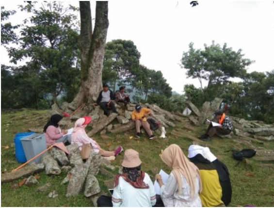
Gambar 2. Pemaparan Materi dari Dosen Pembimbing Lapangan dan Pengelola Gunung Padang

Keterampilan memperoleh informasi mencakup kegiatan mendengarkan dengan penuh perhatian terkait materi yang disampaikan oleh dosen, kemudian mahasiswa melakukan observasi dengan akurat, mahasiswa harus mampu mencari sumber baik data primer maupun dari data sekunder. Kemudian setelah itu mahasiswa harus mampu mengumpulkan, menganalisis data dan menarik kesimpulan dari apa yang didapatkan di lapangan.