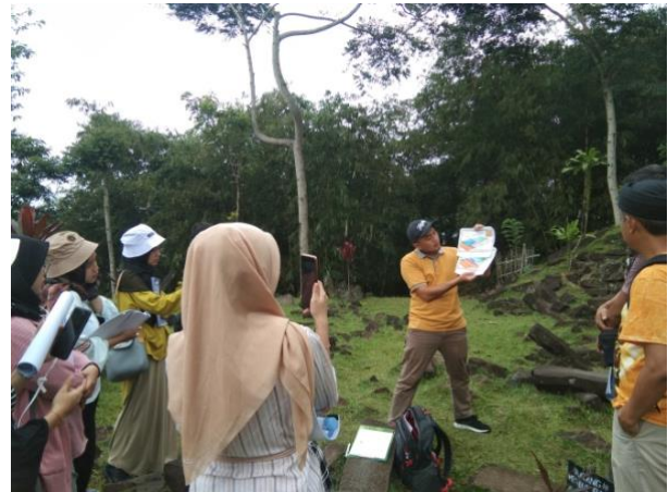
Gambar 3. Keterampilan mengorganisasikan (Sumber : Hasil Peneliti 2024)

membandingkan informasi yang didapatkan dari data sekunder dan dibandingkan dengan data primer. Mahasiswa S2 Pendidikan Geografi aktif dalam kegiatan Praktik Kuliah Lapangan ini, semua mahasiswa sudah dikelompokkan berdasarkan sub-sub kajiannya yang dibedakan menjadi 3 Kelompok yang mengkaji Lingkungan, Budaya dan Pariwisata. Mahasiswa mencari informasi secara mandiri dan sebagai data tambahan berdasarkan dari pemaparan dari dosen. Keterampilan mengorganisasikan ini membandingkan antara teori yang didapatkan dengan data kajian di lapangan.