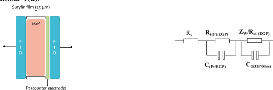
GAMBAR 1. (a) Struktur persambungan pada pengukuran EIS untuk bagian elektrolit gel polimer(EGP). (b) Rangkaian ekuivalen untuk medium matriks ionik.

Untuk mengetahui pengaruh penggunaan berbagai jenis medium bagi cairan ionik mosalyte yang terdiri dari matriks berbasis polietilen glikol dan kopolimer hibrid TMSMA:TEMS, pengukuran spektroskopi impedansi dilakukan hanya pada bagian elektrolit saja, dengan struktur konfigurasi seperti pada gambar 1(a).